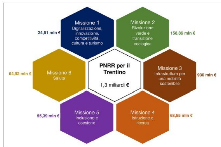
Interventi PNRR in Trentino per missione

Nei prossimi anni le Amministrazioni locali beneficeranno delle risorse del PNRR per finanziare investimenti in alcuni rilevanti comparti di attività. In Trentino sono previsti 1,3 miliardi di euro per un totale di 52 interventi distribuiti tra le sei missioni; gli interventi i cui soggetti attuatori sono enti locali (Provincia e Comuni in primis) ammontano a circa 382 milioni di euro.